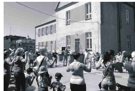
Wspólne zajęcia z rodzicami w jednym z przedszkoli w gminie Koronowo.

edukacji przedszkolnej, 100 proc. badanych odpowiedziało „Tak”. Również zdaniem prawie wszystkich rodziców projekt wpłynie na poprawę warunków rozwoju ich dziecka. Z tych odpowiedzi wynika więc, że założenia projektu są zgodne z diagnozą sytuacji i identyfikacją potrzeb mieszkańców gmin uczestniczących w projekcie.