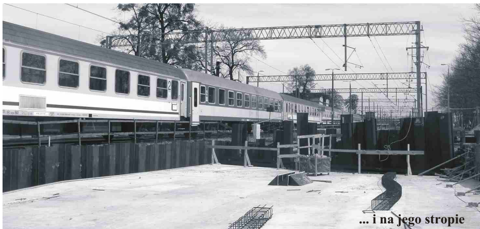
... i na jego stropie

W związku z pracami przy budowie wiaduktu w nocy z 26/27 maja br. w godz. 20.20 - 2.20, z 27/28 maja br. w godz. 23.00-2.15 oraz z 28/29 maja br. w godz. 22.45-2.15 konieczne jest prowadzenie prac związanych z zabijaniem ścianek szczelnych na terenie kolejowym i tym samym przygotowanie placu budowy pod wykonanie klatki schodowej i szybu windowego w celu zapewnienia bezpiecznego dojścia na planowany peron wyspowy. Powodem prowadzenia prac w porze nocnej, jest zamknięcie całej linii kolejowej na odcinku Bydgoszcz - Toruń przez gestora sieci kolejowej tj. PKP PLK S.A. Terminy te zostały wybrane ze względu na mniejszą liczbę pociągów poruszających się w tym czasie, co zminimalizuje utrudnienia w komunikacji kolejowej na linii Bydgoszcz - Toruń. Za utrudnienia przepraszamy w imieniu inwestora i wykonawcy.