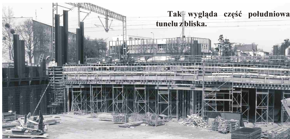
Tak wygląda część południowa tunelu z bliska.