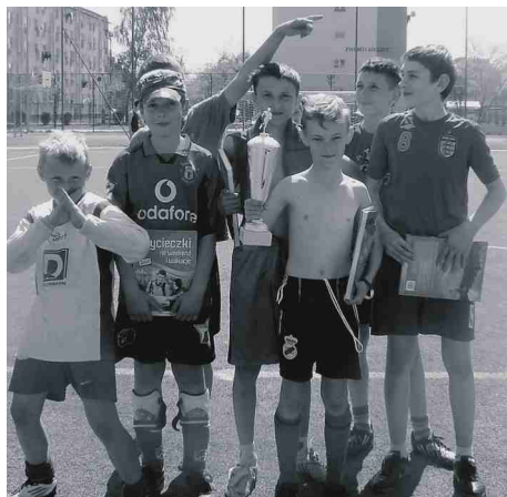
Zwycięska drużyna Arsenalu.