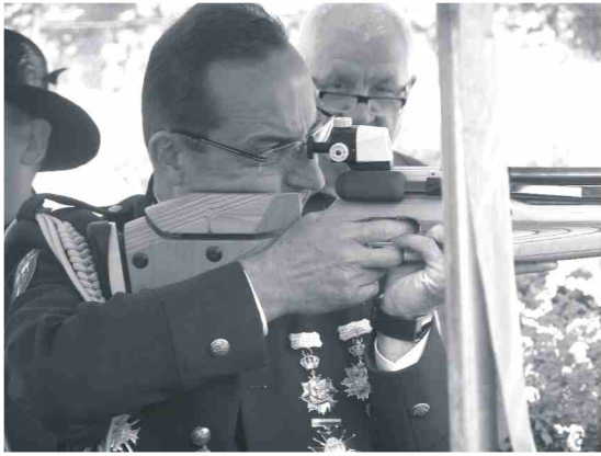
Wielu strzelało, wygrać mógł tylko jeden.