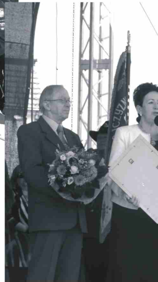
Były gratulacje i nagrod słodki poczęstunek dla mies