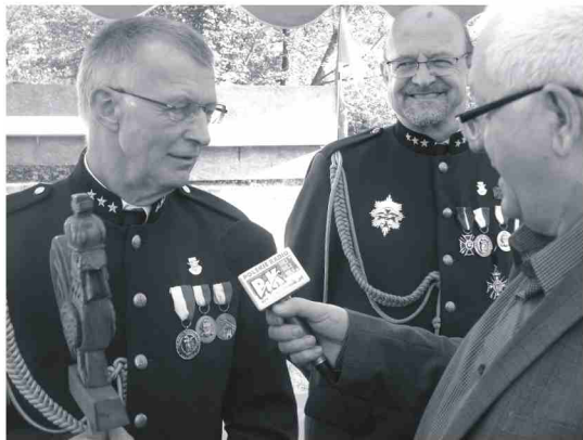
Po mszy na rynku ustępujący król przekazał łańcuch następcy. Nowo przyjęci bracia złożyli ślubowanie. Wszyscy goście temu towarzyszyli.