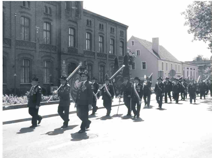
Kolorowy bracki korowód przemaszzerował ulicami miasta.