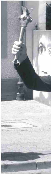
Szkocka z Częstochowy, przez marszałk wspaniałej gry.