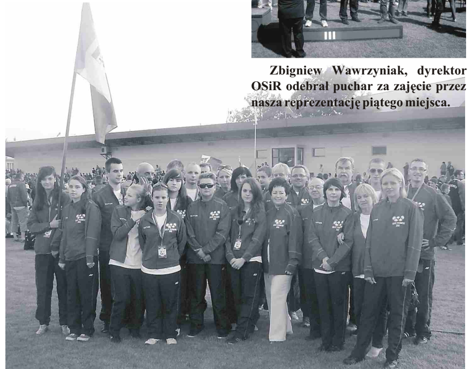
Reprezentanci Solca Kujawskiego wraz z wiernymi kibicami podczas otwarcia Igrzysk w Tucholi.

UKS „TOP” zaprasza na VI turniej cyklu Grand Prix amatorów w tenisie stołowym, który odbędzie się 30 czerwca br. w sali Zespołu Szkół (ul. Tartaczna 25). Początek o godz. 16.00. Prawo startu mają osoby powyżej 16. roku życia, nie zrzeszone w Polskim Związku tenisa Stołowego. Zapisy tel. 693 091 515 lub przed zawodami. Wpisowe 10 zł.