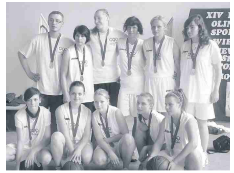
Srebrna drużyna koszykówki.

Wszystkim reprezentującym nasze miasto na olimpiadzie i w eliminacjach serdecznie dziękujemy. Za cztery lata podobna impreza, tym razem Chełmno Rio de Janeiro 2016.