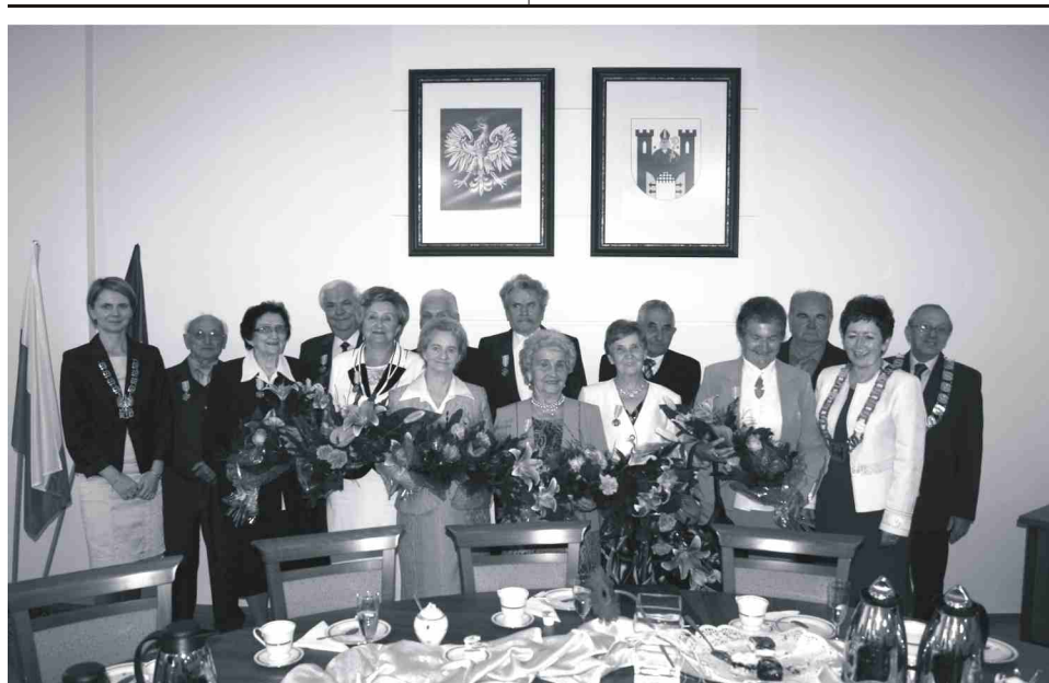
Sześć par małżeńskich 7 września otrzymało medale "Za długoletnie pożycie małżeńskie". Nicco więcej na str. 5.

górką saneczkową, być może stadionem lekkoatletycznym.