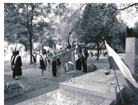
Przedstawiciele samorządu, soleckich instytucji i zakładów pracy, kombatancki oraz młodzież szkolna i mieszkańcy uczcili 1 września pamięć ofiar drugiej wojny światowej.

Najpierw jednak musi zakończyć się projekt rekultywacji gruntu, co przewidziane jest do 2015 r.