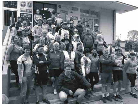
W Dobrzyń nad Wisłą.

Lato 2012 solecki Klub Turystów Rowerowych TORPEDO spędził bardzo aktywnie na rajdach i zlotach w Lubostroniu, Inowrocławiu, Zielonej Strudze, Żurczynie, Cekcynie, Górsku, Przyjezierzu. Nasi rowerzyści zjeździli też pobliskie okolice Puszczy Bydgoskiej.