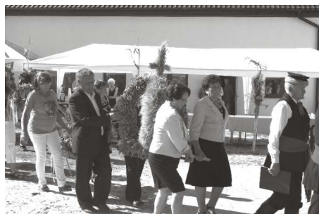
Plon niesiemy, plon...