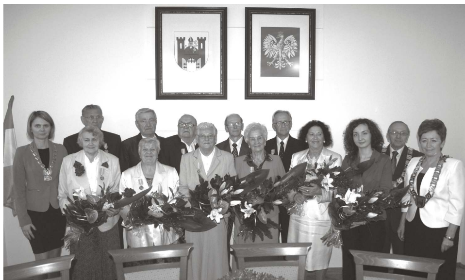
Medale "Za długoletnie pożycie małżeńskie" wręczone. Więcej na str. 5.

Wszystkim nauczycielom i wychowawcom z okazji Dnia Edukacji Narodowej składamy serdeczne podziękowania za trudną i odpowiedzialną pracę w wychowywaniu młodego pokolenia. Życzymy, aby dalsza praca sprawiała Państwu wiele radości i przynosiła satysfakcję.