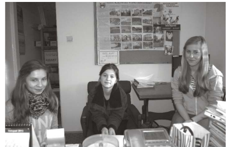
Jedna z grup uczniowskich, która pojawiła się w urzędzie miasta.

Soleckie koło Związku Kombatantów RP i Byłych Więźniów Politycznych zaprasza wszystkich członków koła na zebranie sprawozdawcze połączone ze spotkaniem świątecznym. Zaplanowano je na 11 grudnia br. w sali konferencyjnej urzędu miasta (ul. 23 Stycznia 7, wejście od strony kościoła). Początek o godz. 11.00.