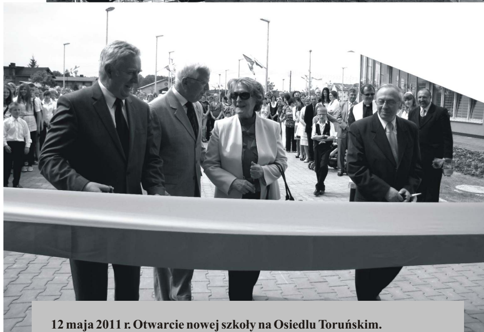
12 maja 2011 r. Otwarcie nowej szkoły na Osiedlu Toruńskim.