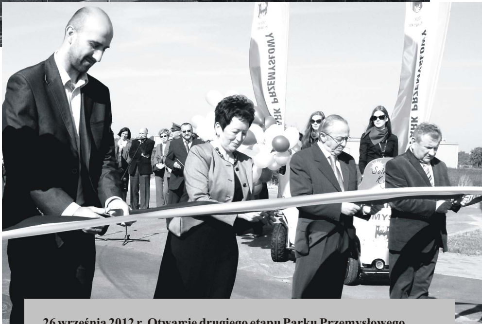
26 września 2012 r. Otwarcie drugiego etapu Parku Przemysłowego.

Niebawem będziemy mogli sprzedawać grunty w Parku Przemysłowym. Decyzja zapadła w Brukseli.