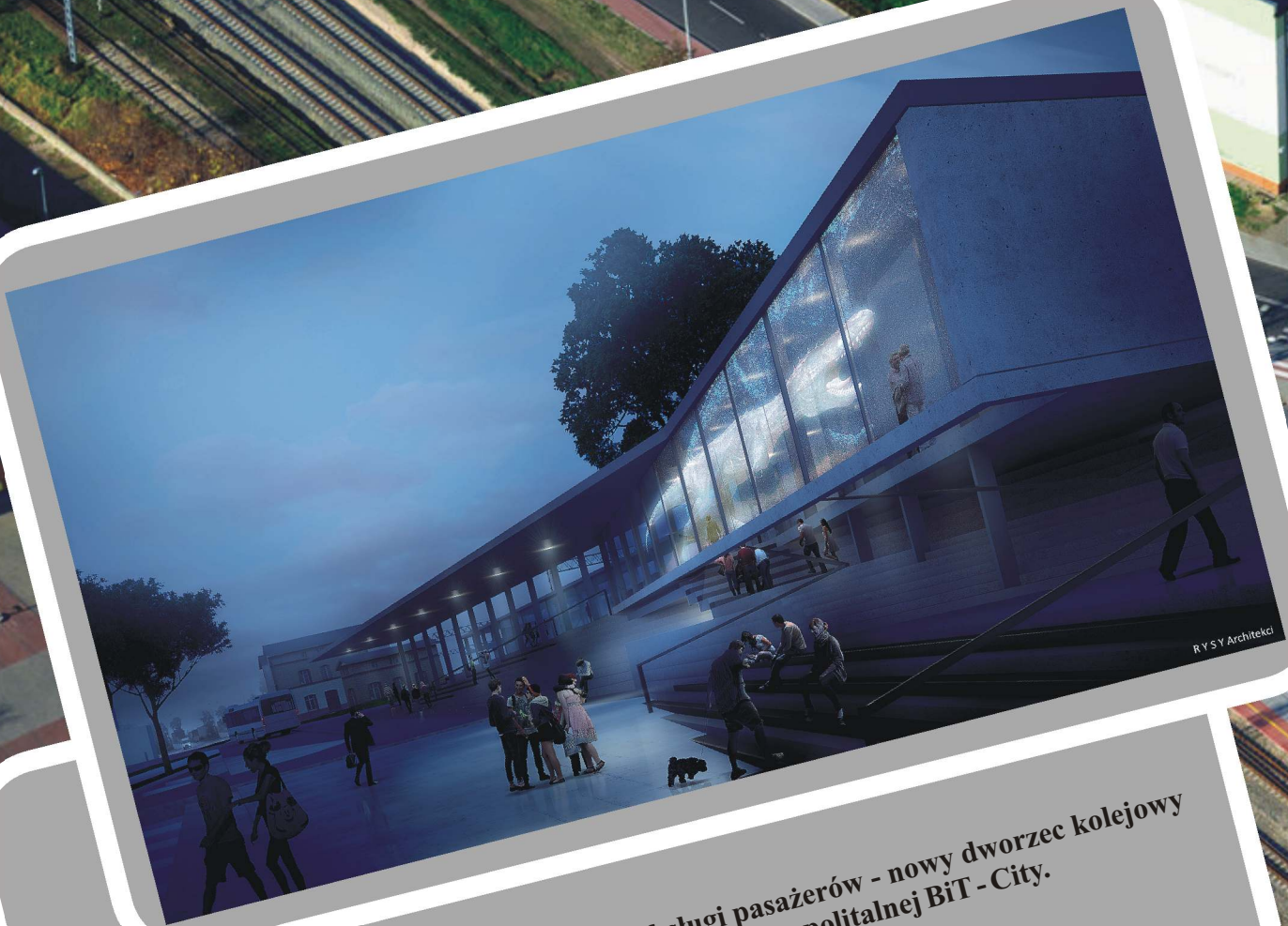
Tak już za rok ma wyglądać punkt obsługi pasażerów - nowy dworzec kolejowy budowany w ramach projektu Szybkiej Kolei Metropolitalnej BiT - City. (Wizualizacje przygotowane przez firmę R Y S Y Architekci)