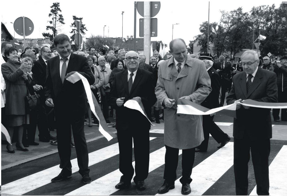
24 września 2013 r. Otwarcie wiaduktu kolejowego.