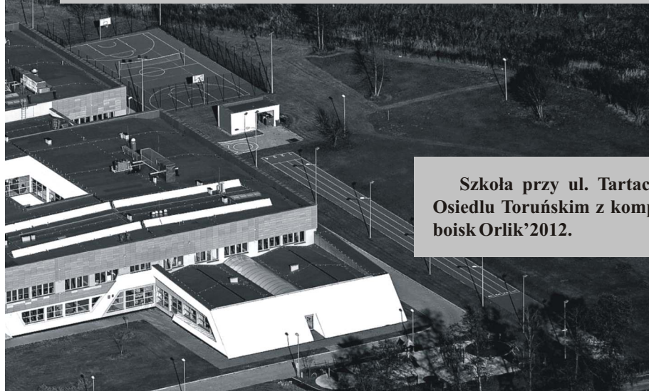
Szkoła przy ul. Tartacznej na Osiedlu Toruńskim z kompleksem boisk Orlik 2012.