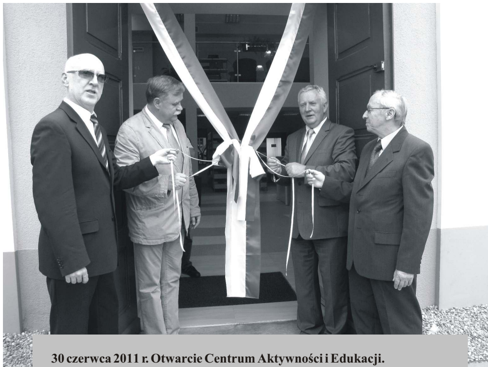
30 czerwca 2011 r. Otwarcie Centrum Aktywności i Edukacji.

Solec jest jednym z samorządowych liderów funduszy unijnych.