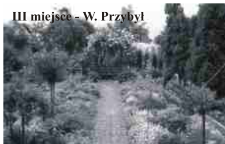
III miejsce - W. Przybył