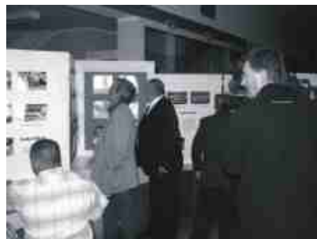
Można było obejrzeć wystawę poświęconą klubowi.