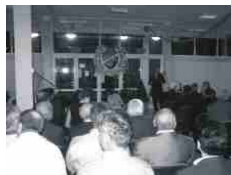
Na jubileuszowe spotkanie przybyli sportowcy, działacze i sponsorzy.

a także ich rodziców. W ramach działań zaplanowano seminarium „Jak wspierać dziecko w wyborze przyszłego zawodu?”, spotkania informacyjne dla młodzieży, spotkania z przedsiębiorcami, utworzenie w szkołach Punktów Planowania Kariery. Gimnazjaliści i ich rodzice będą mogli korzystać z usług doradczych. Projekt jest współfinansowany przez Unię Europejską ze środków Europejskiego Funduszu Społecznego.