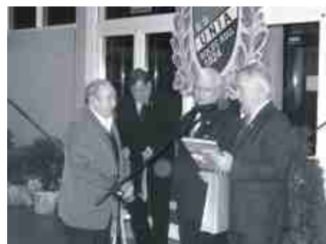
Najstarsi zawodnicy otrzymali album o Solcu.

W projekcie przejazdu uwzględniono dwa ciągi komunikacyjne - chodnik i ścieżkę rowerową, które przecinając ulicę objazdową połączą się ze ścieżką prowadzącą przez park miejski.