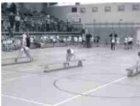
A ławki jakież inne.

Klasy II: 1. Zespół Szkół w Ostromecku - 24 pkt.; 2. Szkoła Podstawowa nr 2 w Koronowie - 22 pkt.; 3. Szkoła Podstawowa w Brzozie - 19 pkt.