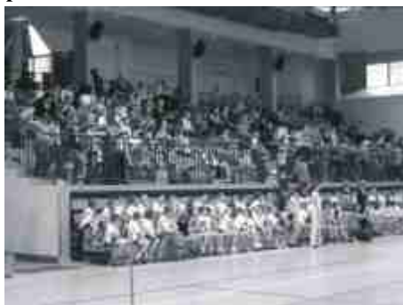
Kibiców było dużo.

Klasy I: 1. Szkoła Podstawowa nr 2 w Koronowie - 33 pkt.; 2. Zespół Szkół w Dąbrowie Chelmińskiej - 20 pkt., 3. Zespół Szkół w Solcu Kujawskim - 19 pkt.