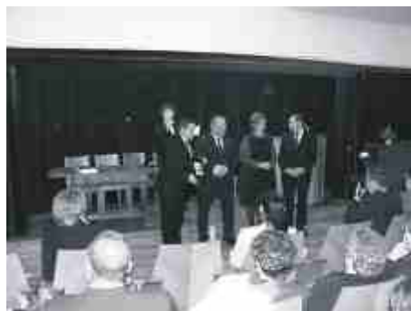
Chwilę po wręczeniu nominacji do nagrody Orzeł Agrobiznesu.

Nagroda Orzeł Agrobiznesu jest przyznawana od ośmiu lat. Dotychczas zdobyło ją 146 firm z branży rolno - spożywczej i z jej otoczenia. Przyznawana jest tym