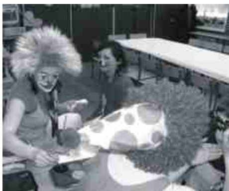
Każdy chciał być pomalowany.

Wszyscy wspólnie bawili się w rytm karnawałowej muzyki na pięknie udekorowanej sali. Atrakcją były konkursy, malowanie twarzy oraz kurs tańca, w którym chętnie wzięli udział wszyscy uczestnicy zabawy. Nie zapomniano także o poczęstunku i skromnych upominkach.