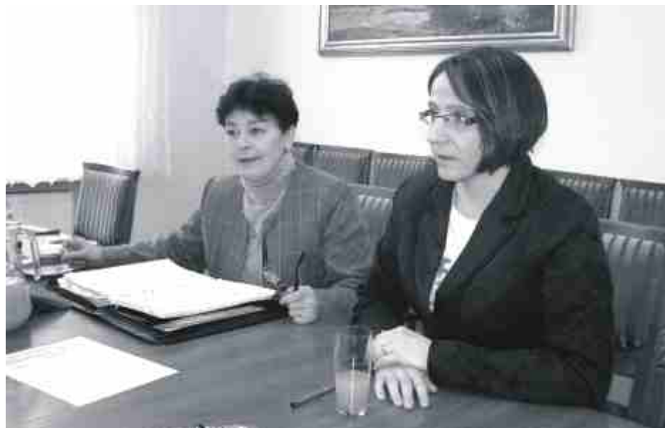
Auditorzy wnioskują o przyznanie naszemu urzędowi certyfikatu potwierdzającego wdrożenie systemu zarządzania jakością.

Certyfikat przyznawany jest na trzy lata. Jednak po pierwszym i drugim roku są audyty sprawdzające, natomiast po trzech latach od wdrożenia systemu przeprowadzany jest audit dla ponownej certyfikacji, jeżeli oczywiście zainteresowany chce go odnowić.