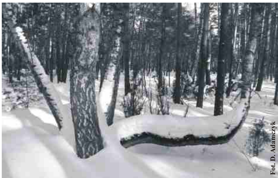
Zima wróciła do nas na chwilę.

Leżał śnieg, więc było biało, kiedy stopniał „GIE” zostało. Szedł maluszek po chodniku, wdepnął w „GIE”, narobił krzyku. Mama w lament - but do prania! Tyle nerwów z piesków s....a. Moja Pani i mój Panie, pies narobił, a sprzątnię?! Wasz czworonóg zwierzę głupie, pamiętajcie więc o kupie. Po spacerze - trudna rada, trzeba sprzątnąć - TAK WYPADA!