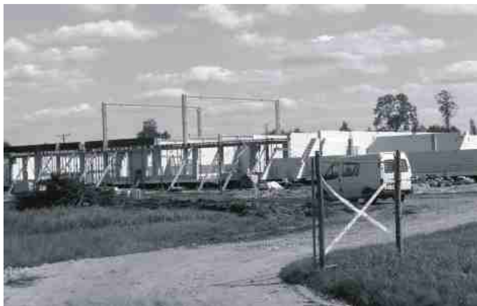
Budowa nowej szkoły na Osiedlu Toruńskim trwa.

minie 730 lat od pierwszej wzmianki o tej wsi, co jest pretekstem do stworzenia wystawy czasowej. Nieco później, gdyż na przełomie listopada i grudnia wszyscy soleccy hobbyści będą mogli zaprezentować swoje zbiory na wystawie „Mam hobby”. R. Kubiak zachęca soleckich pasjonatów do zaprezentowania swoich zbiorów. Zainteresowani mogą się w tej sprawie kontaktować z muzeum tel. 52 387 30 21.