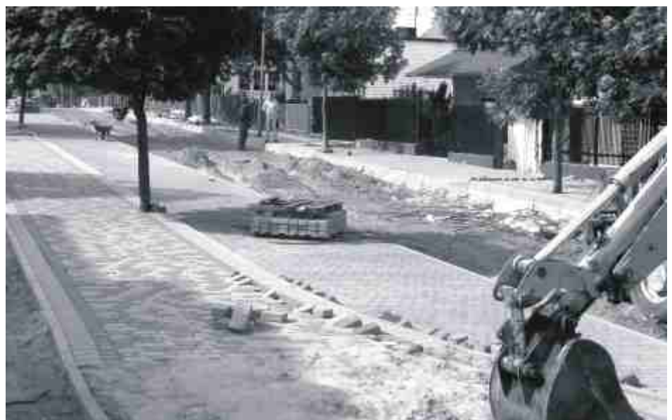
Chodniki i ulice w części Osiedla Staromiejskiego nabierają blasku.

4 LIPCA BR. WYBORY PREZYDENCKIE II TURA LOKALE WYBORCZE CZYNNE OD 6.00 DO 20.00