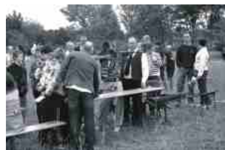
Kto chciał, mógł sprawdzić się w różnych konkurencjach. Można było też postrzelać.