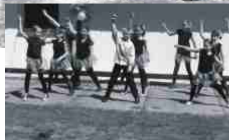
Dzień Dziecka dla podopiecznych Stowarzyszenia im. Sue Ryder.

Osoby niepełnosprawne, które zostały poszkodowane w wyniku skutków powodzi, mogą ubiegać się o pomoc z Państwowego Funduszu Rehabilitacji Osób Niepełnosprawnych Oddział Kujawsko Pomorski w Toruniu. Bliższe informacje można uzyskać w urzędzie miasta (Wydział Utrzymania Miasta, ul. Toruńska 8 pokój nr 4) lub w Miejsko Gminnym Ośrodku Pomocy Społecznej. Wnioski o pomoc są przyjmowane w PFRON w Toruniu do 15 listopada br.