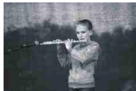
Występy młodych solistów ubarwiły imprezę.