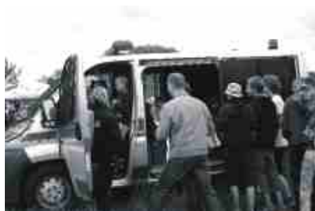
Policja była, ale jedną z atrakcji pikniku.