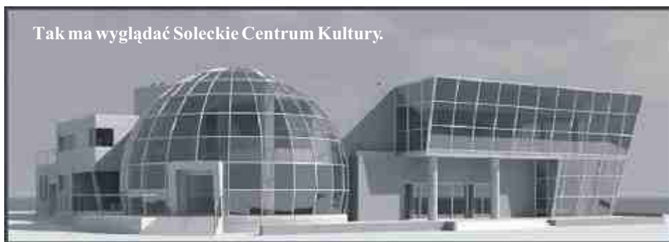
Tak ma wyglądać Solecie Centrum Kultury.

Protokół z sesji dostępny na www.bip.soleckujawski.pl i w biurze rady.