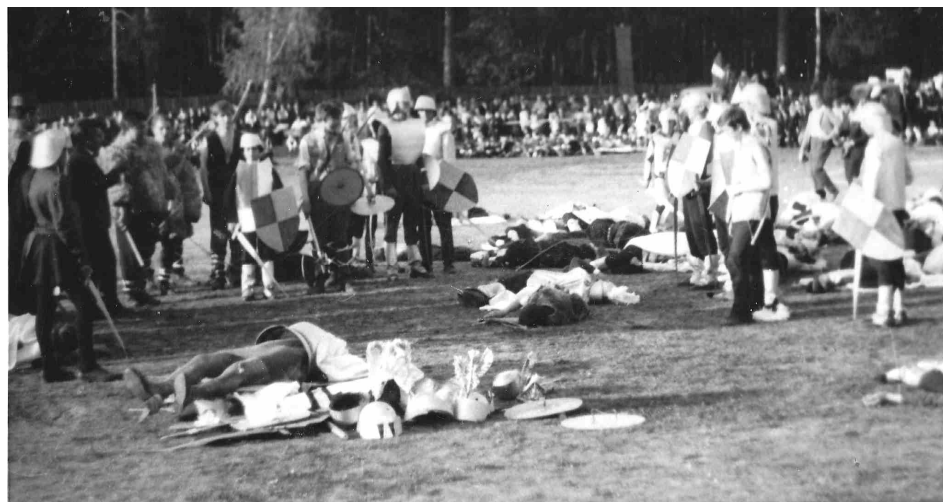
Stadion soleckiej Unii. Inscenizacja bitwy pod Grunwaldem. Prawdopodobnie 1960 r. - 550. rocznica bitwy.

Od 1 lipca można oglądać kolejną wystawę czasową przygotowaną przez soleckie muzeum. Tym razem temat lekki, wakacyjny, związany z wodą. Ekspozycję poświęcono wędkowaniu, a pretekstem jest 80. rocznica powstania koła wędkarskiego w naszym mieście. Natomiast od 15 lipca, w 600. rocznicę bitwy pod Grunwaldem, są prezentowane "Pocztówki z Krzyżakiem". Znajdują się na nich reprodukcje obrazów tematycznie związanych z Krzyżakami począwszy od bitwy pod Grunwaldem, skończywszy na Holdzie Pruskim. Inne przedstawiają zamek w Malborku oraz ilustracje do utworów literackich. Zapraszamy, warto zobaczyć obie ekspozycje.