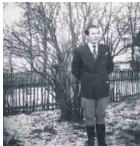
Autor w swoich wspaniałych oficerkach.