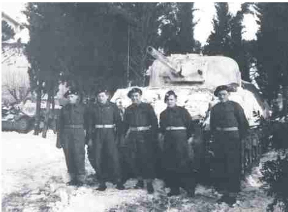
Na froncie włoskim w 1944 r.