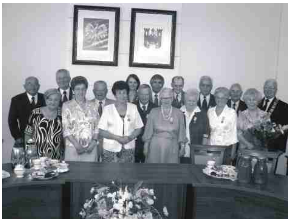
20 sierpnia br. w urzędzie miasta siedem par małżeńskich otrzymało medale Za długoletnie pozycie małżeńskie. Więcej na str. 6/7.

1 września solecki samorząd organizuje obchody 71. rocznicy wybuchu drugiej wojny światowej, podczas których uczymy pamięć wszystkich, którzy zginęli z rąk hitlerowskich okupantów, a także walczyli w wojnie obronnej 1939 r. oraz na frontach II wojny światowej. Będziemy również pamiętać o ofiarach walk z Armią Czerwoną, która napadła na Polskę 17 września 1939 r. i późniejszych - żołnierzach, oficerach, policjantach zamordowanych i pogrzebanych w Katyniu, Miednoje, Charkowie oraz tych wszystkich, którzy nie przeżyli gułagów. Symboliczne wiązanki zostaną złożone przy: Mogile Zbiorowej, poświęconej mieszkańcom naszego miasta zamordowanym w 1939 i 1940 r., Pomniku Niepodległości (oba monumenty są zlokalizowane na cmentarzu przy kościele Św. Stanisława) oraz pod pomnikiem Bohaterom Walki i Zwycięstwa (ul. 29 Listopada). Zbiórka delegacji i pocztów sztandarowych oraz pozostałych uczestników uroczystości przed urzędem miasta o godz. 11.45.