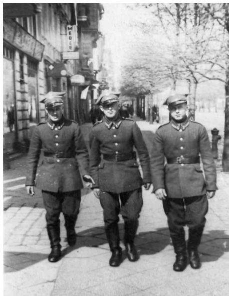
W czasie zasadniczej służby wojskowej. Bydgoszcz 1935 r.

Po włączeniu Litwy do Związku Radzieckiego trafił do rosyjskiej niewoli. Wagonami towarowymi, wraz z innymi jeńcami, został przetransportowany do obozu jenieckiego w miejscowości Juchnowo. Tam oddzielono oficerów i ich wywieziono. Co się później z nimi stało dzisiaj już doskonale wiemy - zostali bestialsko zamordowani przez NKWD. Pozostali żołnierze zostali w obozie, i byli wykorzystywani jako siła robocza przy różnych pracach budowlanych. Nie trzeba dodawać, że warunki życia w obozie były