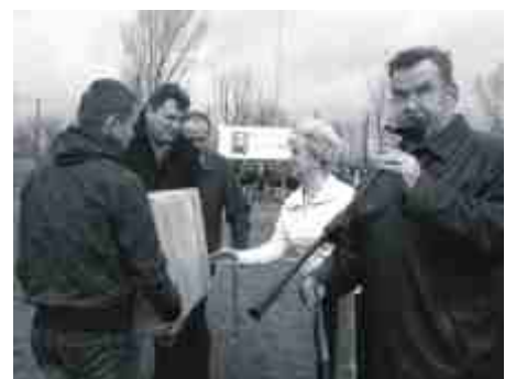
...i przekazali prezenty.