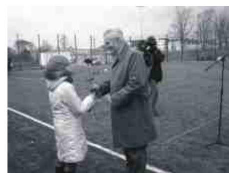
Były też kwiaty.