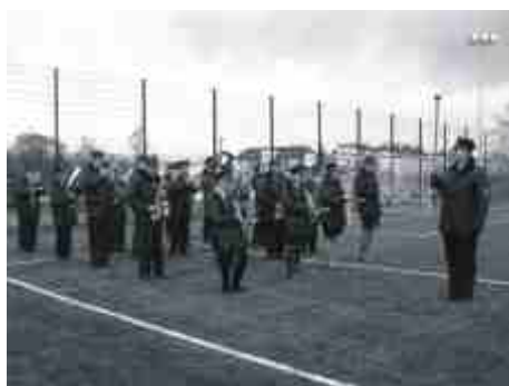
Orkiestra OSP zagrała.