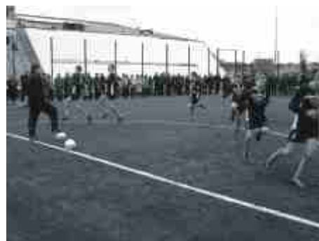
Pierwszy, pokazowy trening na nowym Orliku.

Orlika w sąsiedztwie placu budowy szkoły, to zapewne będzie cieszył się on nie mniejszym zainteresowaniem, niż ten działający przy Szkole Podstawowej nr 4. Dzięki nowej szkole i Orlikowi osiedle zyska miejsce, w którym będzie mogło koncentrować się życie mieszkańców.