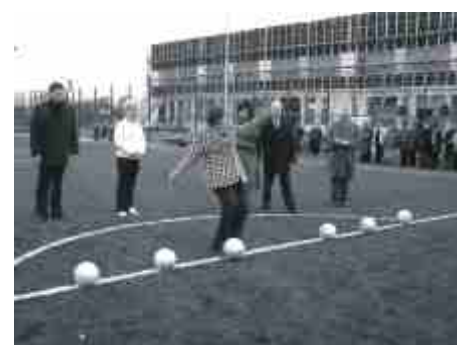
Goście strzelali na bramkę...