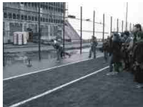
Były pokazy nie tylko piłkarskie.