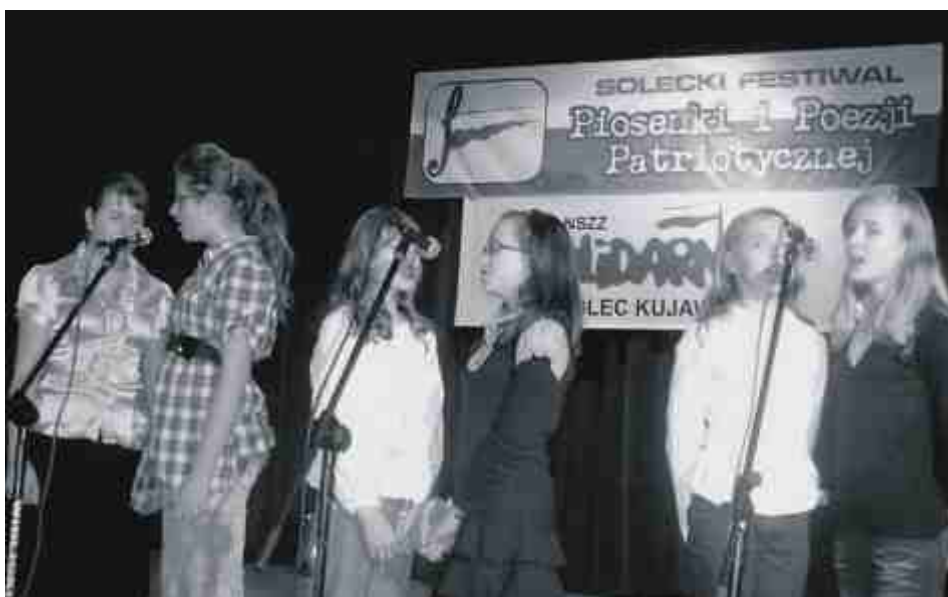
Zespół wokalny ze Szkoły Podstawowej nr 4.

Wystawę można oglądać do połowy grudnia. Muzeum jest czynne od wtorku do piątku w godz. 10.00 - 18.00 oraz w każdą 1 i 3 sobotę oraz niedzielę miesiąca od 11.00 - 17.00.