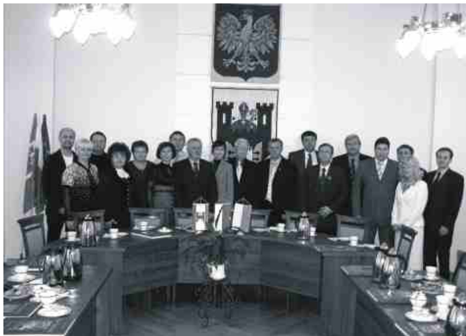
Na zakończenie wizyty w ratuszu tradycyjne wspólne zdjęcie.

Wizyta w Solcu jest częścią wizyty studyjnej, którą zorganizowało Stowarzyszenie Szkoła Liderów wspólnie z lwowską organizacją Dialog Europejski, a współfinansowało Ministerstwo Spraw Zagranicznych RP.