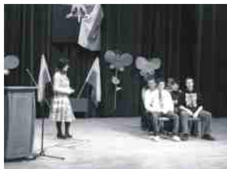
... i prezentacje w ich wykonaniu.