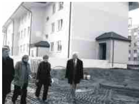
W tym bloku będą mieszkania socjalne.

W styczniu 2009 r. zakończy się budowa budynku z mieszkaniami socjalnymi, usłyszeli radni obok budowanego na Osiedlu Toruńskim bloku komunalnego. Mieszkań będzie 39, w tym 8 jednopokojowych, pozostałe będą dwupokojowe. Standard mieszkań będzie wysoki. Największe mieszkania będą dla rodzin wielodzietnych.