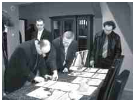
Radni z zainteresowaniem przyglądali się pierwszym muzealnym eksponatom.