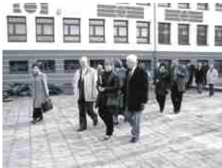
W drodze na nowe boiska.

korzystać ze szkolnego. Obecnie w fazie projektowania jest rozbudowa szkoły właśnie o zaplecze. Boisko jest oświetlone. Dostaliśmy 666 tys. zł dofinansowania. Część z ministerstwa sportu, część z urzędu marszałkowskiego. Burmistrz dodał, że pierwotnie całkowity koszt miał wynieść 1 mln zł. Tyle będzie kosztować wykonanie kompleksu bez pawilonów, bieżni i skoczni. Bolesław Boczkaj, przewodniczący rady miejskiej pytał o możliwość korzystania z boisk i zabezpieczenie obiektu. Burmistrz wyjaśnił, że będą to boiska ogólnie dostępne. Do południa mają być wykorzystywane na potrzeby szkoły, po południu przez wszystkich chętnych. Gmina musi zatrudnić trenera - organizatora, który będzie się tym zajmował.