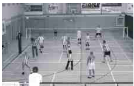
Rewelacyjnie spisali się nasi siatkarze

zajmując I miejsce. Pozostałe konkurencje to bieg z przeszkodami oraz przeciąganie liny.