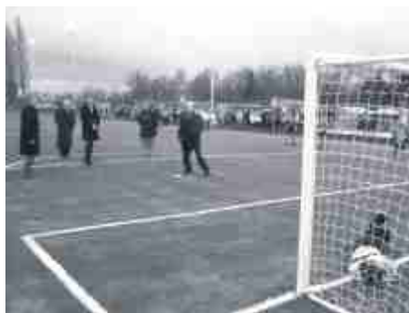
Pierwsze strzały na bramkę...