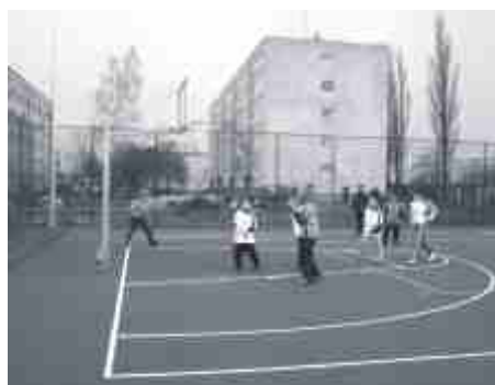
... i mecz koszykówki