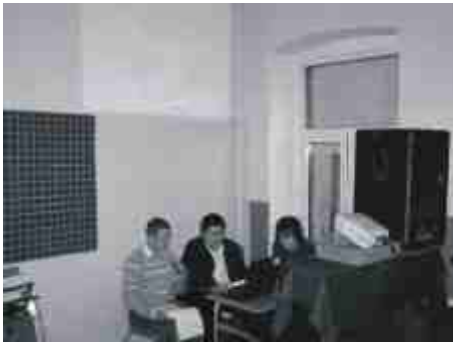
Uczniowie mówili o historii Kujaw.