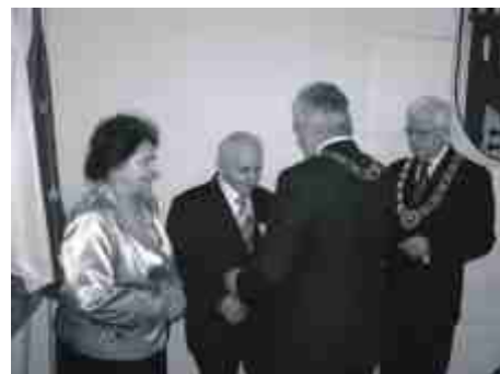
Moment wręczenia medali i przekazania gratulacji.

Zakład Gospodarki Komunalnej jak co roku poinformował o tegorocznych terminach płukania sieci wodociągowej. Będzie ono miało miejsce w dniach: 26 - 27 marca, 28 - 29 maja, 30 - 31 lipca, 24 - 25 września i 7 - 8 grudnia . W tym czasie oraz w wypadku wystąpienia awarii z naszych kranów będzie lecieć zabrudzona woda. Dlatego w wymienionych terminach warto mieć przygotowaną wcześniej wodę do picia.