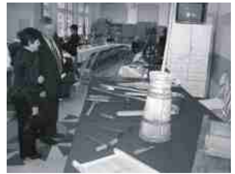
Przygotowano także wystawę.