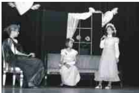
Występ teatryku Kurtynka.