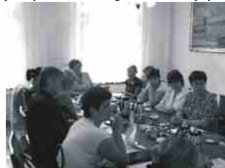
Pierwsze spotkanie gminnych koordynatorów projektu.

W ramach działań zaplanowanych w projekcie przewidziano między innymi wydłużenie czasu pracy przedszkoli, dodatkowe zajęcia z języka angielskiego, informatyczne, korekcyjne, logopedyczne, rytmikę z elementami tańca, muzyczne, plastyczne, ekologiczne. Kolejnymi