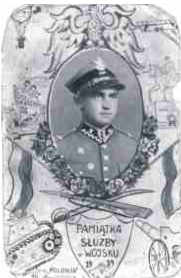
W Wojsku Polskim w latach 1938 - 1939.