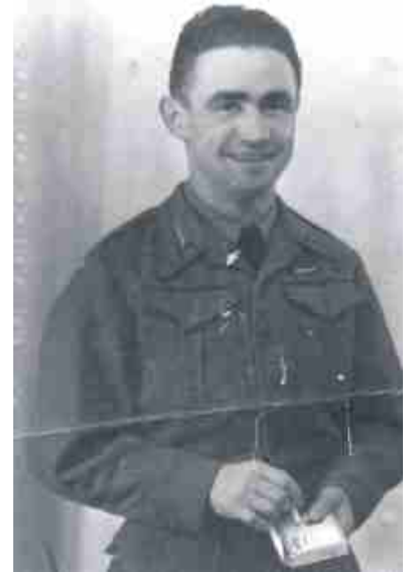
Jako żołnierz drugiego frontu.

brał udział w walkach w Normandii o Caen i Falaise, a po wyzwoleniu Francji i Belgii walczył w Holandii, gdzie został ciężko ranny w walkach o Bredę (z 29 na 30 października, wcześniej 20 października awansowany do stopnia kaprała). Rannego odesłano do szpitala w Oxfordzie, a następnie do polskiego szpitala, w którym leczył się do wyjazdu do Polski w 1947 r.