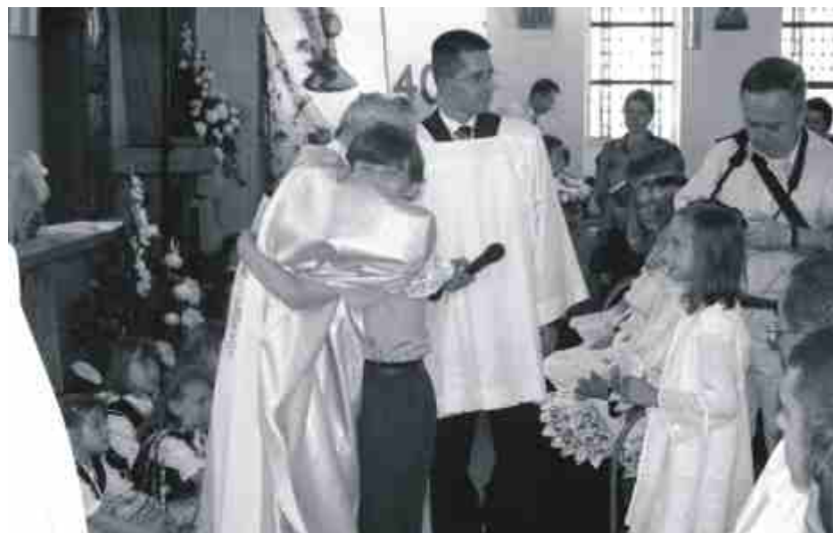
... najmłodszych solecczan.