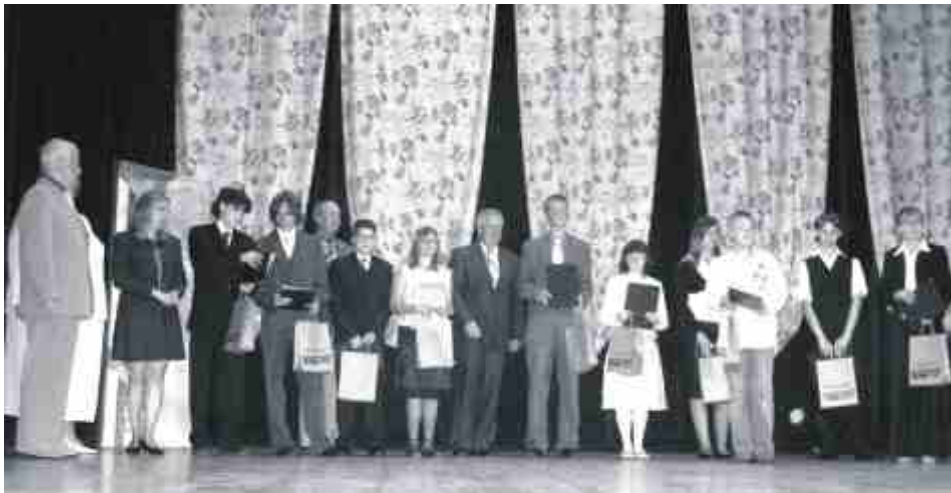
Uczniowie, którzy otrzymali stypendia naukowe.