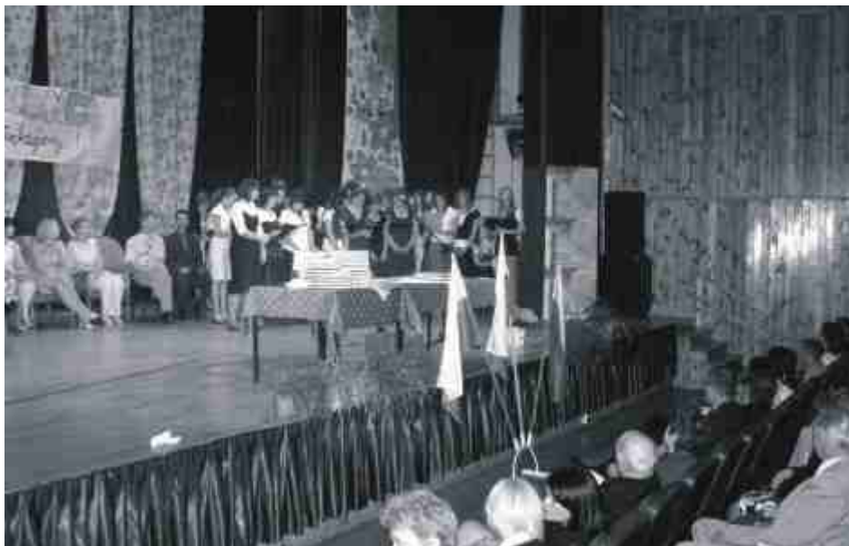
Ostatni, pożegnalny występ absolwentów klas trzecich Gimnazjum Publicznego nr 2 podczas uroczystości zakończenia roku szkolnego w Soleckim Centrum Kultury.