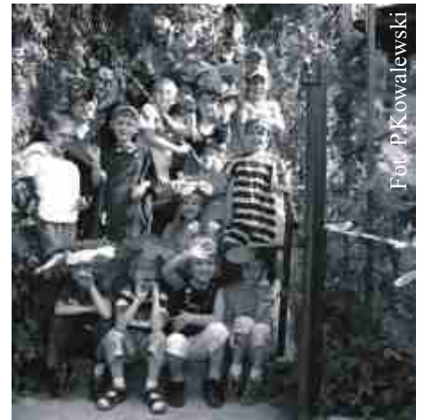
Zdobywcy Grand Prix - kl. IB z SP nr 1.

„Kabaret Horrorek”, „Wszystko dziś dla Mamy”, „Król Czasu”, „Dzielny Tomcio Paluch i dwunastu braci”, „Jestem czysty będę zdrowy”, „Muzykanci z Bremy” to tytuły bajek, które na scenie Zespołu Szkół przy ul. Kościuszki zaprezentowali uczniowie z soleckich szkół i przedszkoli. 13 czerwca, piątkowego, przysłowiowego pecha dzieci postanowiły odczarować zabawą i uśmiechem. Z powodzeniem wcieliły się więc w bajkowe postaci. - Występy uzupełniała kolorowa, baśniowa scenografia i wspaniałe kostiumy. Młodzi aktorzy wykazali się talentem i doskonałym warszatem. Spektakle urozmaiciła skoczna muzyka przeplatana wesołymi piosenkami i wdzięcznym tańcem. Przedstawienia bardzo się spodobały publiczności.