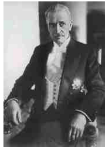
Ignacy Mościcki, prezydent Polski w latach 1926 - 1939.

Głowa Państwa tym razem podróżowała samochodem. Uroczysty wjazd do Bydgoszczy szosą szubińską nastąpił o godzinie 10 przed południem. Po nabożeństwie w bydgoskiej farze prezydent udał się na plac Kochanowskiego gdzie dokonał odsłonięcia pomnika. W czasie uroczystości prezydentowi przedstawiono bohatera walki z germanizacją w zaborze