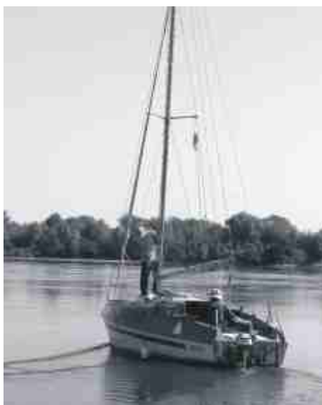
Czas w dalszą drogę. Do Gdańska.

1 sierpnia o godz. 17.00 w naszym mieście przez minutę zawyją syreny. Będzie to symboliczne upamiętnienie rocznicy wybuchu Powstania Warszawskiego, które rozpoczęło się właśnie o godzinie siedemnastej. Syreny zostaną uruchomione na podstawie rozporządzenia rady Ministrów z 16 października 2006 r. oraz decyzji MSWiA z 15 lipca br.