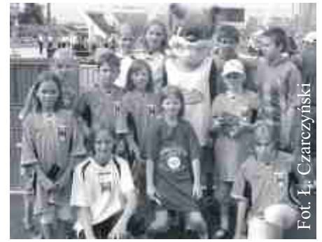
Zdjęcie z maskotką mistrzostw.

Warto zaznaczyć, iż udział wspaniale dopingującej grupy z Solca Kujawskiego został zauważony przez organizatorów bydgoskich mistrzostw, którzy przyznali nam trzecie miejsce w konkursie Klubów Kibica oraz nagrodzili radiomagnetofonem oraz zestawem upominków. Tegoroczne półkolonie, współfinansowane przez urząd miasta na pewno będą mile wspomniane przez wszystkich, którzy brali w nich udział i miejmy nadzieję, że przyczynią się do dalszego zainteresowania sportem przez solecką młodzież.