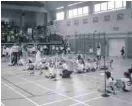
Młodzi sportowcy rywalizowali w rozmaitych konkurencjach sprawnościowych o miano

28 marca w hali sportowej rozegrano coroczny turniej zabaw sportowych dla najmłodszych klas Szkoły Podstawowej nr 4.