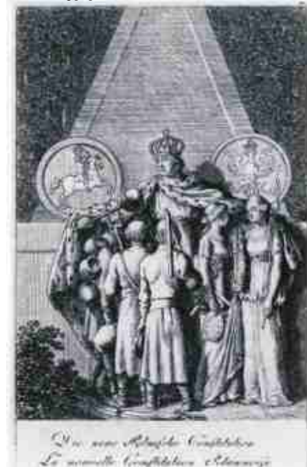
Alegoria Daniela Mikołaja Chodowieckiego nawiązująca do uchwalenia Konstytucji 3 Maja ze zbiorów Biblioteki Narodowej w Warszawie znajdująca się na www.wilanow-palac.art.pl