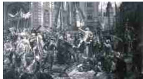
Obraz Jana Matejki - Konstytucja 3 Maja 1791 r. Namalowany w setną rocznicę jej uchwalenia.