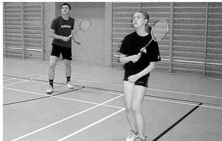
Srebrni medaliści już na treningu w soleckiej hali.