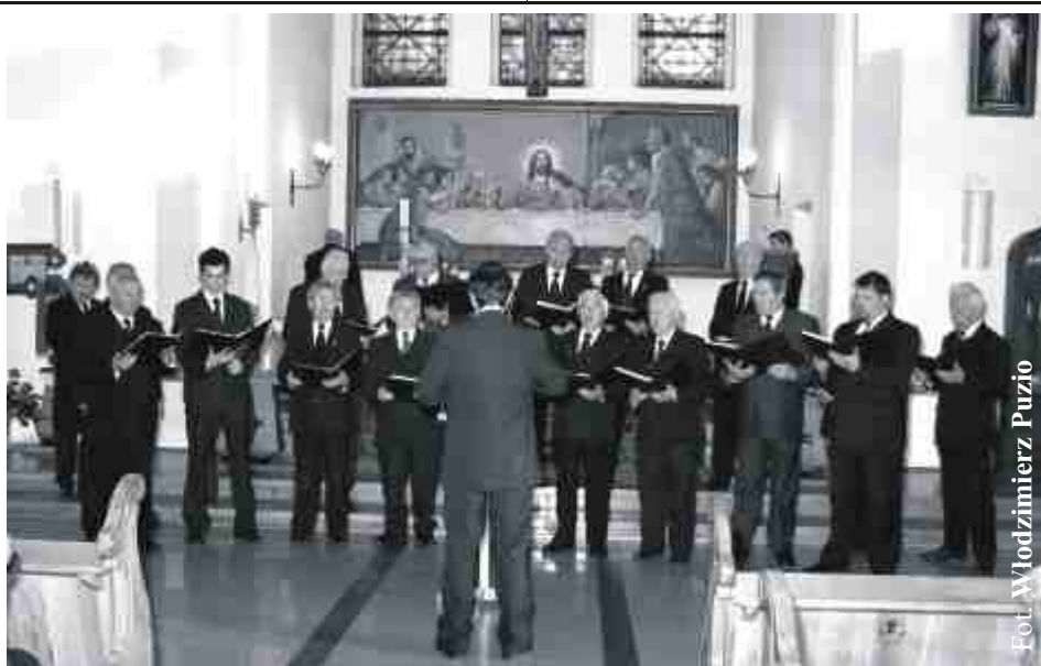
3 maja w kościele Najświętszego Serca Pana Jezusa odbył się koncert z okazji rocznicy uchwalenia Konstytucji 3 Maja. Wystąpili śpiewacy Stowarzyszenia Śpiewaczego Męski Chór “Hasło”.

dzieci i młodzieży “STROFKA”- zapisy chętnych do udziału uczniów szkół podstawowych klasy od IV do VI oraz gimnazjalistów przyjmujemy do 17 maja w SCK - p. 110; tel. 052 387 98 24.