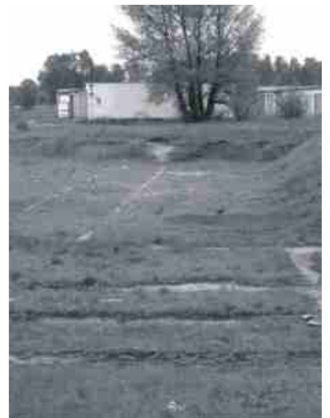
W tym miejscu ma powstać budynek z mieszkaniami socjalnymi.

Gmina zamierza ubiegać się o dofinansowanie tej inwestycji w ramach rządowego programu dotyczącego finansowego wsparcia tworzenia lokali socjalnych.