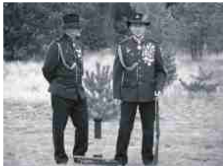
Swoją obecność zaznaczyło też bractwo kurkowe.