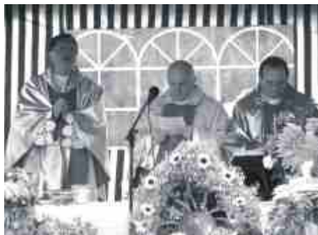
Rozpoczęły się tradycyjnie Mszą Św.