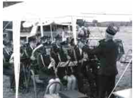
Uroczystość uświetniła orkiestra strażacka.