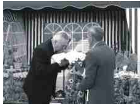
i powitaniem burmistrza chlebem i solą.