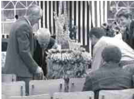
Najpiękniejszy wieniec dożynkowy przygotowało sołectwo Otorowo - Makowiska.