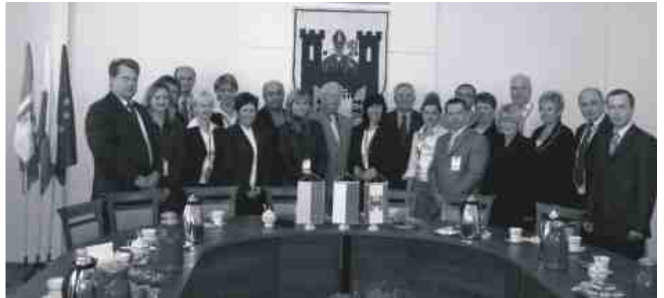
Na zakończenie wizyty w ratuszu była obowiązkowa, wspólna fotografia.

Wizytę koordynowało Stowarzyszenie Rozwoju Solca Kujawskiego.