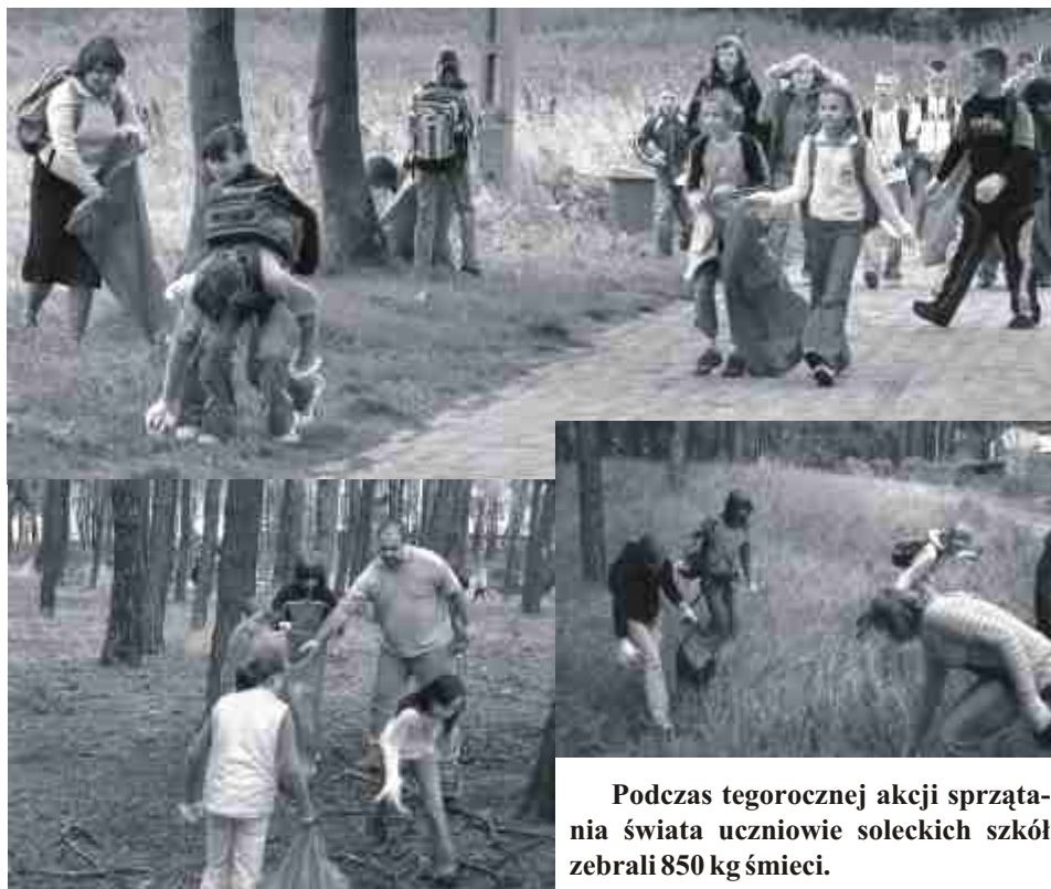
Podczas tegorocznej akcji sprzątnięcia świata uczniowie soleckich szkół zebrali 850 kg śmieci.

Władze UKW zadeklarowały możliwie szybkie wprowadzenie projektu umowy o współpracy pod obrady senatu uczelni.