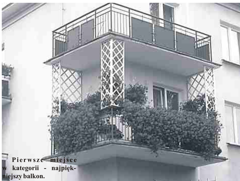
Pierwsze miejsce w kategorii - najpiękniejszy balkon.