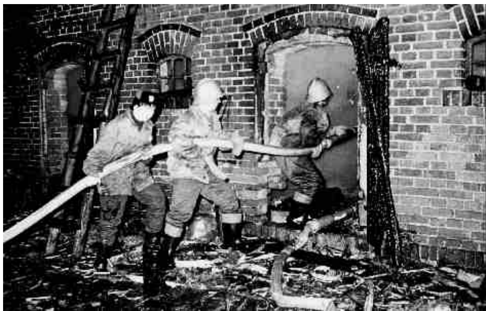
Na podstawie pracy magisterskiej Wiesława Papierskiego „100 lat Ochotniczej Straży Pożarnej w Solcu Kujawskim”, Bydgoszcz 1991 r.