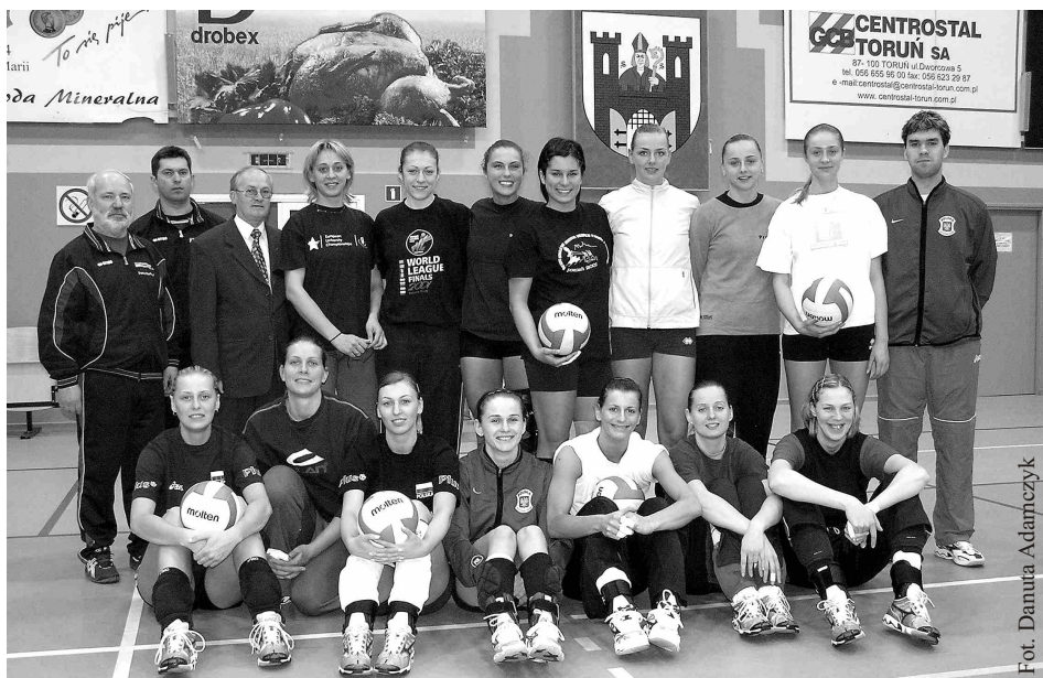
Siatkarki Centrostalu Focus Park Bydgoszcz przebywały na zgrupowaniu w Solcu.