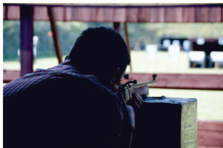
Potem kilka celnych strzałów.