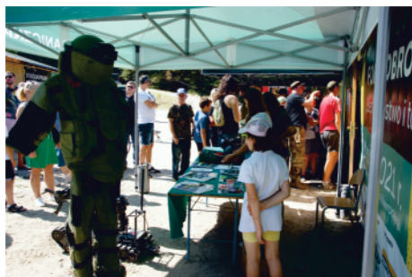
Najpierw trzeba było poczekać w kolejce.

Kolejny piknik strzelecki, impreza organizowana z soleckim Kurkowym Bractwem Strzeleckim z okazji Święta Wojska Polskiego, była bardzo udana. Strzelnicę w Przylubiu odwiedziło sporo soleczan, korzystających z przygotowanych atrakcji. Były stoiska gastronomiczne, zabawy dla dzieci i strzelanie z łuku. O swojej pracy mówili policjanci i funkcjonariusze Straży Granicznej.