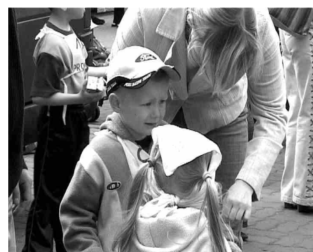
Jednak nie wszyscy byli zadowoleni z zajętego miejsca.