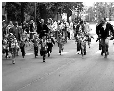
W biegu towarzyszyli zawodnikom rodzice - trenerzy.