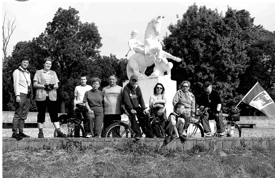
Wspólna fotografia pod pomnikiem Leszka Białego.

W tegorocznej edycji wojewódzkiego konkursu plastycznego „Obrona cywilna wokół nas” wzięło udział ponad 300 uczniów szkół podstawowych i