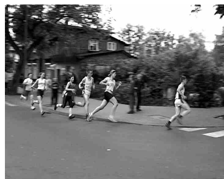
Na trasie każdy walczył ile sił. Wszyscy chcieli wygrać.