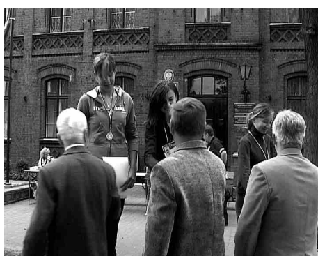
i odebrać puchary, medale, dyplomy.