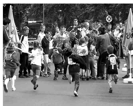
Już meta ...