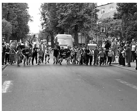
Wszyscy na start.

Zwycięzcom, ale także pozostałym uczestnikom rywalizacji gratulujemy.