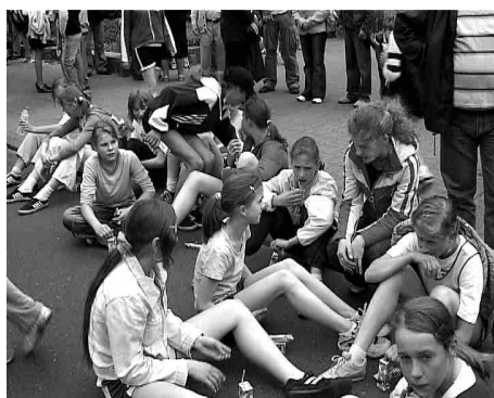
... można odpocząć