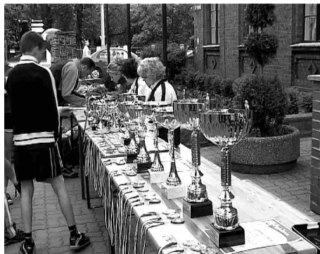
Puchary czekały na zwycięzców.

4 czerwca br. rozegrano II Bieg Uliczny o Puchary Przewodniczącego Rady Miejskiej i Burmistrza Solca Kujawskiego.