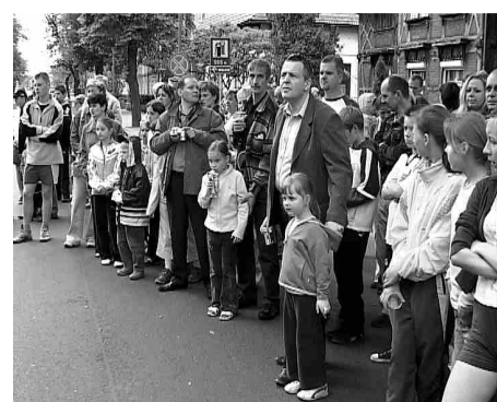
Pozostali kibice byli bardziej zdyscyplinowani.