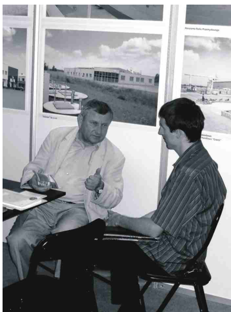
Studenci pytali o warunki oferowane przez solecki Inkubator Przedsiębiorczości młodym firmom.

Pierwszy dzień był poświęcony polsko niemieckiej współpracy gospodarczej. Drugiego dnia w auli Uniwersytetu Mikołaja Kopernika członkowie zarządu województwa zaprezentowali „Regionalny Program Operacyjny na lata 2007 2013” ( Władysław Kubiak ), „Agglomera-