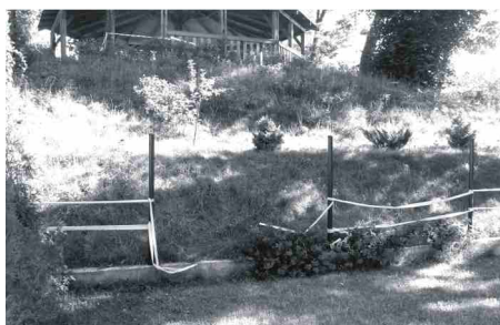
Tędy szli złodzieje.

Właściwie to, co się stało kilka dni temu na terenie SP nr 1 trudno przemilczeć, choć z drugiej strony, jak życie pokazuje, takie apele, publiczne piętnowanie nie przynosi zamierzonego efektu. Kradzieże jak były, tak są i niestety, pewnie będą. Rzecz jednak w tym, aby nie przechodzić