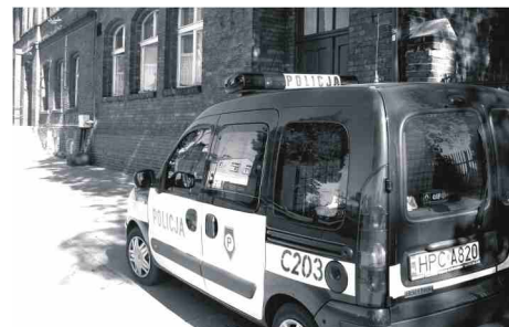
Oby także w tym wypadku policja była skuteczna.