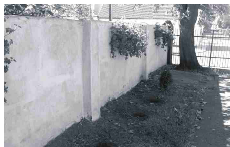
Po drzewkach zostały tylko dziury.