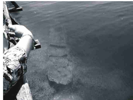
Średniowieczna łódź - dłubanka.