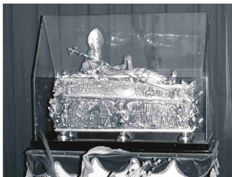
Relikwie Św. Wojciecha.

liczne znaleziska, dobrze zachowane, ponieważ setki lat znajdowały się one w wodzie.