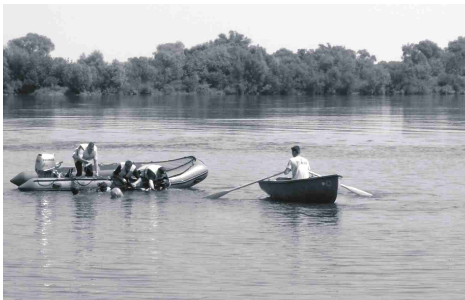
WOPR-owcy i strażacy sprawnie przeprowadzili akcję.

Na Wiśle na wysokości Saliny doszło do tragicznego wypadku. Na informację o tonącym człowieku szybko zareagowali ratownicy Wodnego Ochotniczego Pogotowia Ratunkowego i strażacy pletwonurkowie z sekcji ratownictwa wodnego ochotniczej straży pożarnej. Szybko wydobyli z wody tonącego, przetransportowali go na brzeg, gdzie rozpoczęli reanimację. Akcja zakończyła się powodzeniem. Na szczęście były to tylko ćwiczenia przeprowadzone przed kamerami telewizyjnymi, na potrzeby powstającego programu edukacyjnego o bezpieczeństwie nad wodą. Pokazowi przyglądali się też uczestnicy kolonii z Ukrainy, przebywający w harcówce.