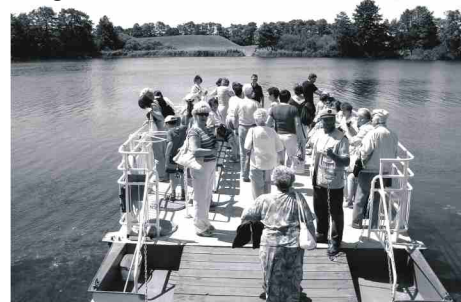
Prom na Ostrów Lednicki.

Jak widać, wrażeń było co niemiara, pogoda dopisała, wszyscy zadowoleni, po pysznym obiedzie w Żninie, wrócili do naszego miasta, które również może poszczycić się wczesnymi początkami swego istnienia.