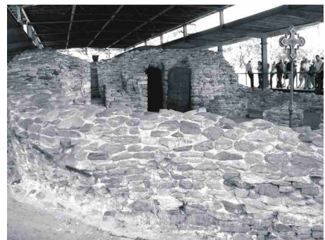
Tu Mieszko I przyjął chrzest.