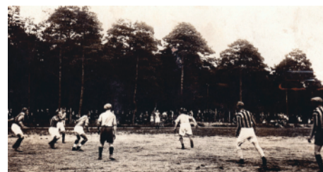
Mecze piłkarskie w Parku Miejskim są rozgrywane od 1928 r.

Tak dobra drużyna zasługiwała na lepszą bazę sportową, a boisko na targowisku cieszyło się bardzo złą opinią. Na wniosek wielu organizacji, władze Solca, mimo problemów finansowych, zdecydowały się powiększyć mały plac do ćwiczeń, który znajdował się w Parku Miejskim. Tak, w 1928 r., powstał stadion, który służy soleckim piłkarzom do dziś.