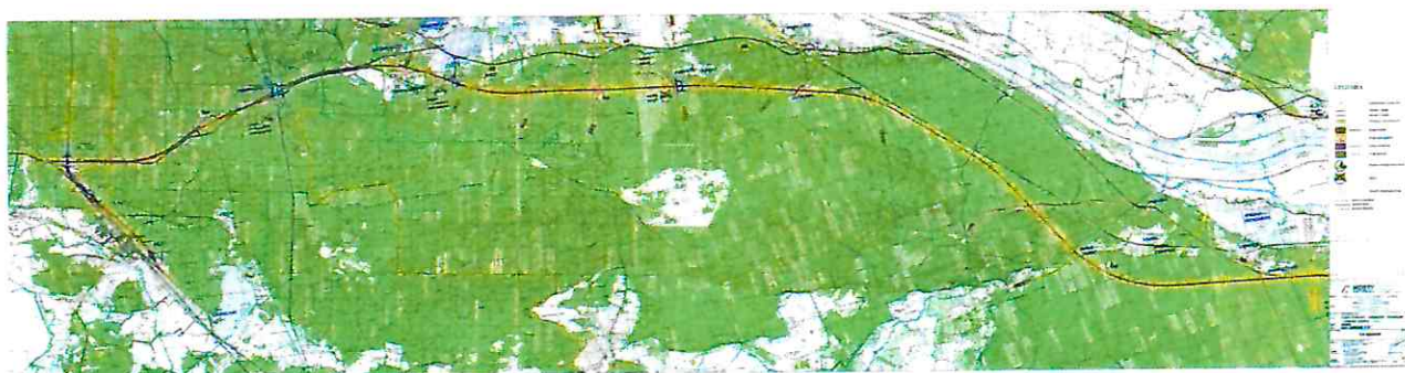
Planowany przebieg S-10

2.1.4 Budowa drogi łączącej S10 z DK80 poprzez stopień wodny w Solcu Kujawskim wraz z przeprawą drogową