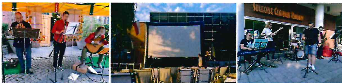
Spotkania kulturalne przy SCK

Rok 2020 z powodu pandemii koronawirusa SARS-COV-2 w Polsce był dla kultury okresem niełatwym. Mimo obostrzeń sanitarnych, które z poziomu centralnego zamknęły na dużą część roku działalność placówek kultury i kin, utrzymywano działalność Soleckiego Centrum Kultury (SCK) na wszystkich możliwych polach, oraz przeniesiono jak największą część oferty do internetu. Między innymi powstał kanał na portalu YouTube, na którym prezentowano serwis informacyjny nt. kultury i działalności SCK. Wydawano periodyki – "Skarbiec" klubu kolekcjonera i nowy - "SCK Koronaserwis Info". Kontynuowano działanie galerii Homo Faber, która cały czas (dzięki nowej instalacji wystawienniczej - także plenerowo) prezentuje prace artystów.