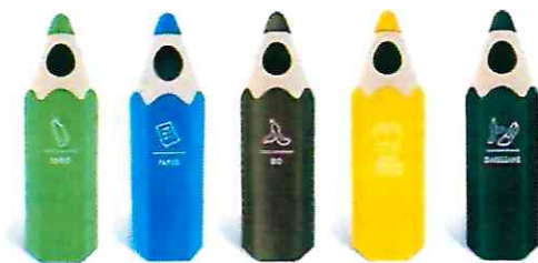
Kosze edukacyjne na placach zabaw