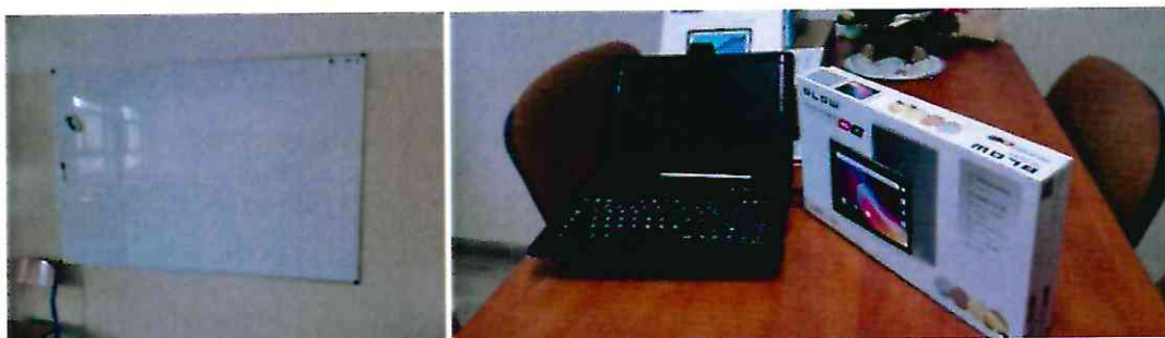
Nowy sprzęt dydaktyczny SP 4