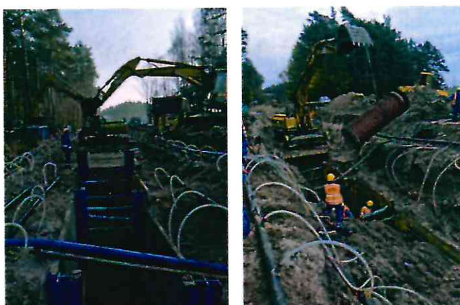
Budowa sieci kanalizacji deszczowej w ul. Targowej

Zakres rzeczowy zrealizowanych inwestycji obrazuje poniższa tabela: