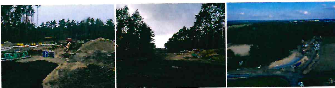
Budowa kanalizacji deszczowej i zbiornika retencyjnego