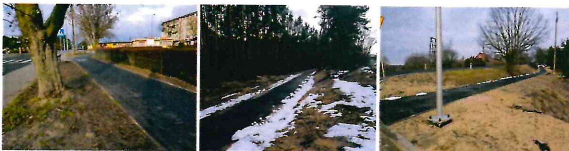
Ścieżka rowerowa łącząca Solec Kujawski z Otorowem i dalej z Łęgowem