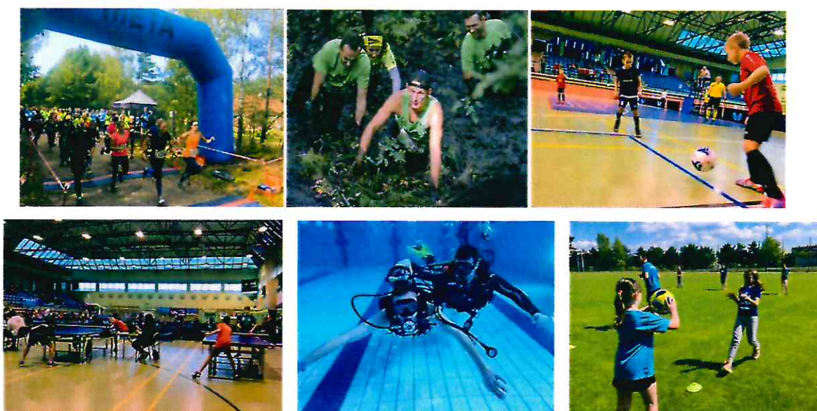
Imprezy rekreacyjno – sportowe

Ponadto w OSiR odbyły się m.in.: finałowy etap Orszaku Trzech Króli (styczeń 2020 r.), blok imprez 28. Finału Wielkiej Orkiestry Świątecznej Pomocy (styczeń 2020 r.), turniej „Wiselka Cup” (marzec 2020 r.), IV Bieg najeżony przeszkodami "Jeżyk" (wrzesień 2020 r.), trzy Ogólnopolskie Turnieje Tenisa Stołowego (Festiwal, Turniej o puchar PZTS oraz Turniej Świąteczny – październik – grudzień 2020 r.), cykl Turniejów Halowej Piłki Nożnej Unia CUP (listopad – grudzień 2020 r.).