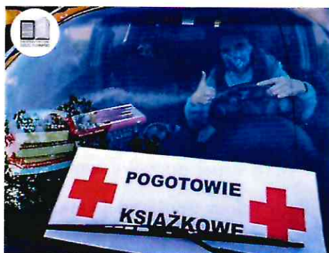
Pogotowie książkowe m.in. dla seniorów