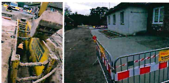
Przebudowa sieci kanalizacyjnej w ul. Robotniczej