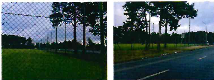
Przebudowa boiska treningowego