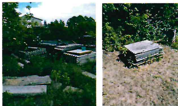
Odebrany i zutylizowany azbest

odebrane odpady niebezpieczne zawierające azbest. 17 czerwca 2020 roku Gmina Solec Kujawski zleciła firmie ECO-POL Sp. z o.o. w Pruszczu odbiór, transport oraz unieszkodliwienie odpadów niebezpiecznych zawierających azbest od osób prywatnych z terenu miasta Solec Kujawski. Odpady niebezpieczne zawierające azbest w ilości 12,43 Mg zostały przekazane do utylizacji na składowisko odpadów niebezpiecznych w Małociechowie. Gmina Solec Kujawski poniosła koszty odbioru, transportu i unieszkodliwienia w wysokości 4.847,70 zł.