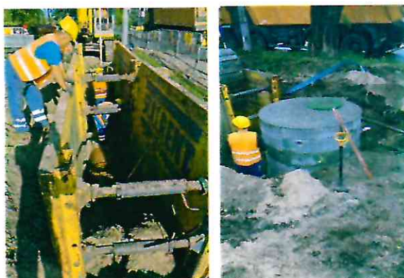
Budowa kanalizacji deszczowej w ul. Długiej