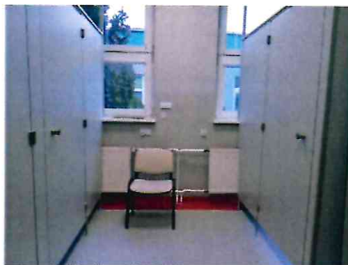
Zmodernizowany gabinet fizjoterapii

Ponadto rozpoczęto remont i przebudowę gabinetu fizjoterapii jako działanie mające na celu podniesienie jakości świadczonych usług.