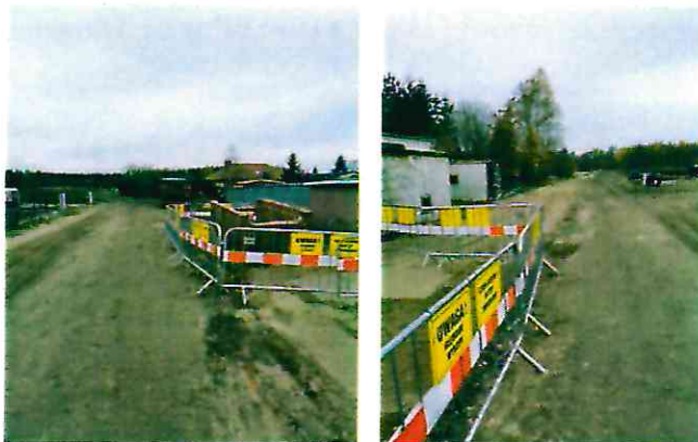
Budowa sieci wod – kan w ul. Sowiej