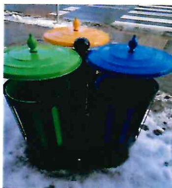
Kosze uliczne do segregacji odpadów