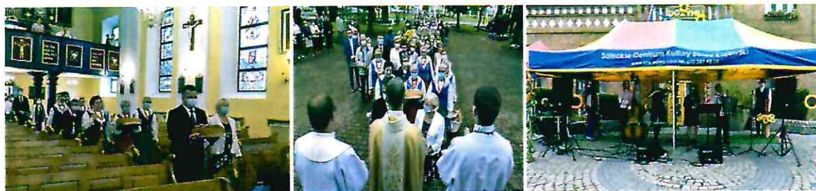
Dożynki 2020 r. „inne niż zwykle”