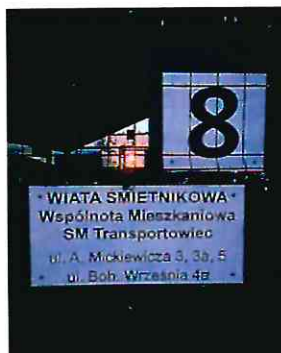
Oznakowanie wiat śmietnikowych na terenach osiedli mieszkaniowych.

W styczniu 2020 r. oznakowano wiaty śmietnikowe. Koszt wykonania tablic – 2.550,00 zł.