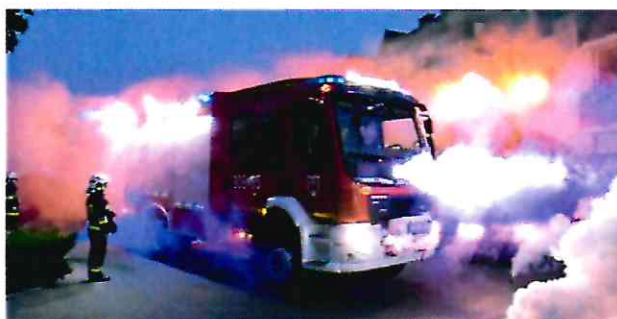
Nowy samochód ratowniczo – gaśniczy OSP Solec Kujawski

Ponadto przekazano kwotę 20.000,00 zł. Komendzie Miejskiej Policji w Bydgoszczy w celu zapewnienia dodatkowych pieszych patroli na terenie Solca Kujawskiego, które prowadzone były w rejonach najbardziej zagrożonych.