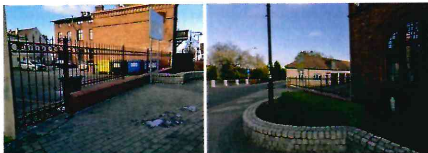
Przebudowa ogrodzenia przy budynku UM