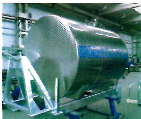
Cysterna na wodę pitną

Ochotnicza Straż Pożarna jest systematycznie wyposażona ze środków własnych oraz dotacji przekazanych przez Gminę, Komendę Główną PSP, sponsorów : Firma Solbet Sp. z o.o. z siedzibą w Solcu Kujawskim oraz Toruńskie Zakłady Graficzne Zapolex Sp. z o.o.