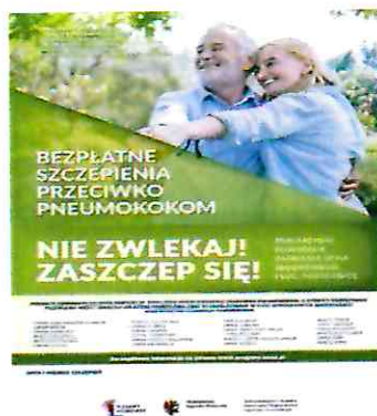
Plakat informacyjny programu szczepień