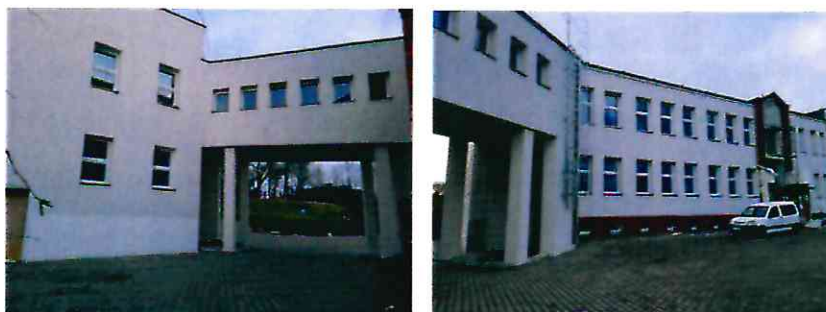
Rewitalizacja budynku przy ul. Kościuszki 12 (segment C)

Zakończono i rozliczono termomodernizację segmentu A i B.