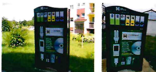
Miejskie Punkty Zbiórki Elektroodpadów na terenie Młodzieżowej Spółdzielni Mieszkaniowej i Osiedlu Leśnym

W lipcu i w październiku 2020 r. zamontowano kolejne dwa Miejskie Punkty Zbiórki Elektroodpadów w pobliżu wiaty śmietnikowej przy ul. Toruńskiej 58B i 58D na terenie Młodzieżowej Spółdzielni Mieszkaniowej w Solcu Kujawskim oraz przy ul. Powstańców na terenie Osiedla Leśnego w Solcu Kujawskim. Nowoczesne urządzenia mają na celu propagowanie świadomości ekologicznej mieszkańców. Zawierają 7 osobnych tub do zbierania takich frakcji elektroodpadów jak: żarówki, baterie, telefony, ładowarki, płyty cd, tonery. Instalacje posiadają również dużą powierzchnię reklamową, wykorzystaną na funkcję informacyjno-edukacyjną. Koszty zakupu i montażu instalacji wyniosły 43.100,40 zł brutto.