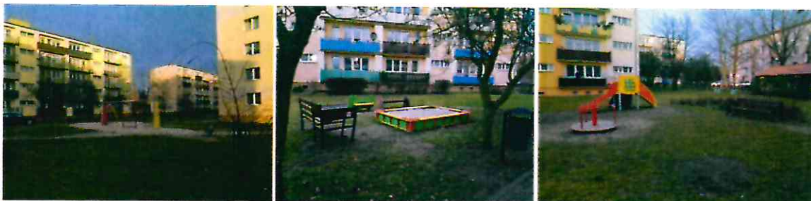
Plac zabaw na Osiedlu Staromiejskim

Wykonawcą robót była firma Biuro Handlowe Małgorzata Kosmecka z Bydgoszczy, z którą w czerwcu zawarto umowę na kwotę 73,6 tys. zł. brutto.