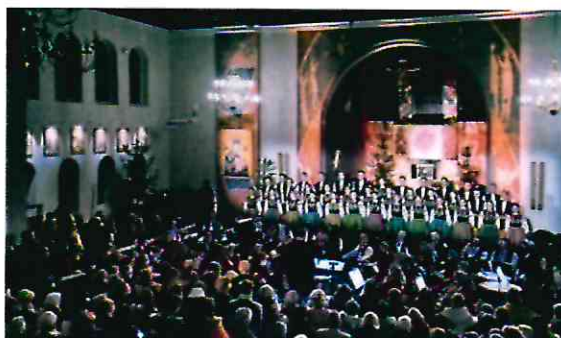
Zespół Mazowsze w Solcu Kujawskim