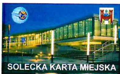
Zniżkowa karta na przejazdy autobusami PKS

Funkcjonuje „ Solecka Karta Miejska ”, wprowadzona na podstawie porozumienia z PKS Bydgoszcz.