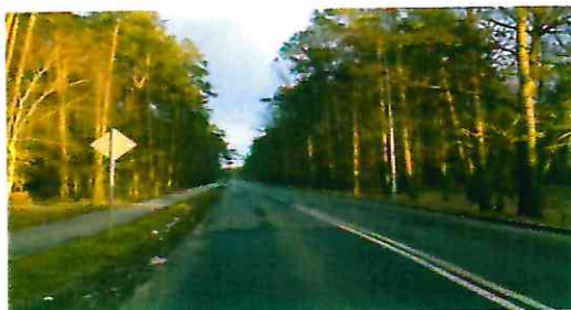
II etap oświetlenia ul. Średniej