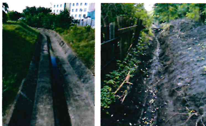
Rowy melioracyjne i ich utrzymanie to bardzo istotne zadanie dla gospodarki wodnej na terenie gminy

Ponadto 17 marca 2020 Gmina Solec Kujawski wystąpiła z pismem do Regionalnej Dyrekcji Ochrony Środowiska w Bydgoszczy o zezwolenie na odstrzał sześciu osobników bobra zwyczajnego, który buduje tamy na rowie soleckim R-C oraz o zezwolenie na rozebranie tam, które zostały na ww. rowie wybudowane. Dnia 4 sierpnia do tut. Urzędu wpłynęła decyzja RDOŚ w Bydgoszczy, która nie zezwoliła na odstrzał zwierząt.