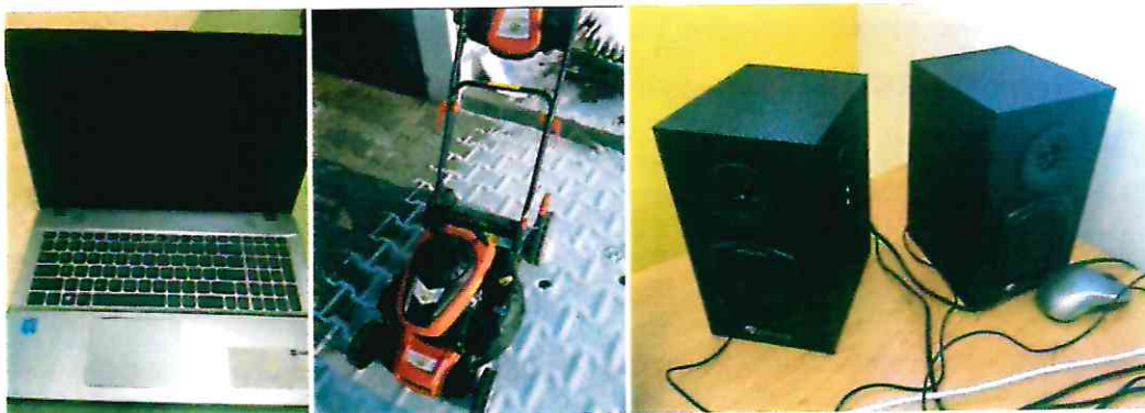
Doposażenie w sprzęt SP nr 1