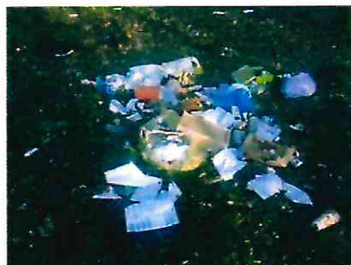
Dziki wysypiska w Wypaleniskach

4.3.2 Rekultywacja składowiska odpadów (nieczynnego)