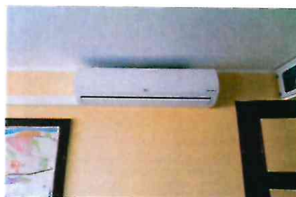
System klimatyzacji w budynkach UM