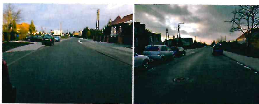
Przebudowana ul. Prosta

Dofinansowanie: Zadanie uzyskało dofinansowanie z Funduszu Dróg Samorządowych w wys. 4.970.583 zł.