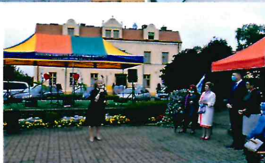
Uroczyste otwarcie „Domu Dobrych Praktyk”