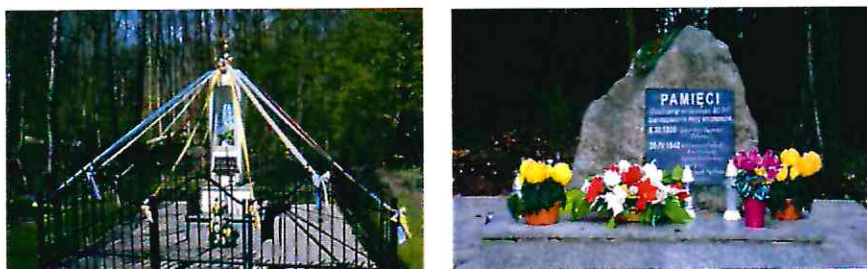
Obelisk i Kapliczka w Rudach