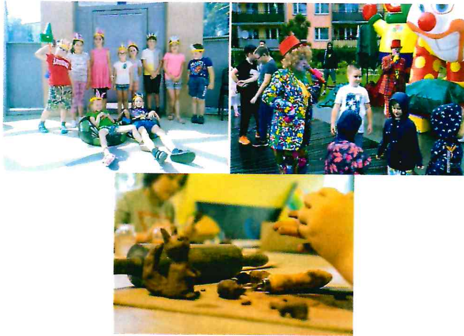
Zajęcia dla dzieci i młodzieży w SCK